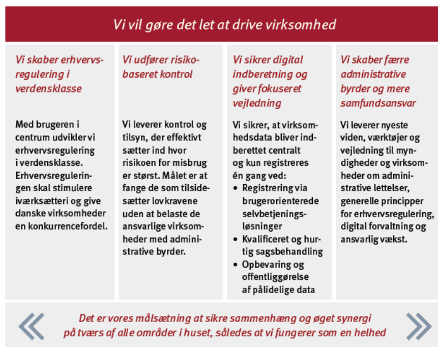
Figur 1.1 Erhvervs- og Selskabsstyrelsens vision